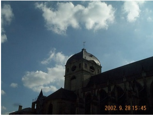
Azimut de la prise de vue : 177 gr