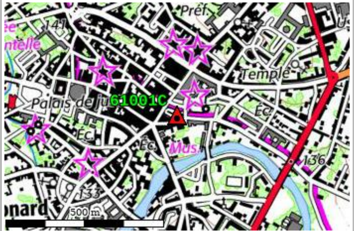
Carte : 1716 ALENCON